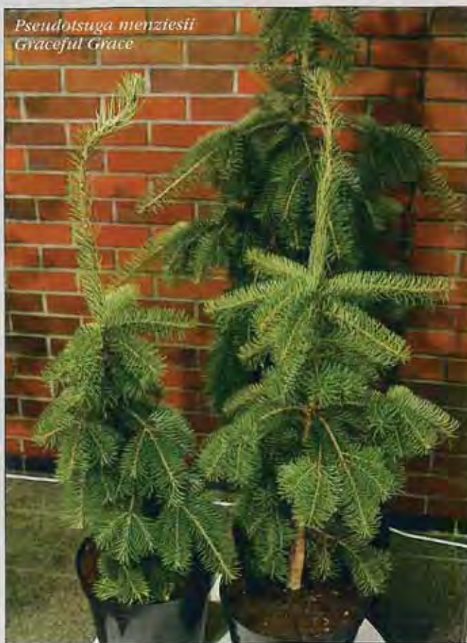
Pseudotsuga menziesii Graceful Grace

gas lesz. Tülevelei aranyárgával sávozottak, a sárga csík télen vöröses színűre változhat. Bármilyen jó vízáteresztő talajban kielégítően fejlődik. Napos, szélétől védett helyekre való. Teljesen fagyűrő. A fajta eredete ismeretlen, valószínűleg Ausztráliából érkezett Európába. A Krzewów Faiskola mutatta be.