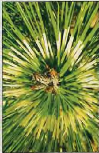
▲▼ Pinus densiflora Rainbow

A Pinus densiflora Rainbow lassú növekedésű, évenként mindössze 10-15 cm-t nő. Kifejletten 2-3 méter ma-